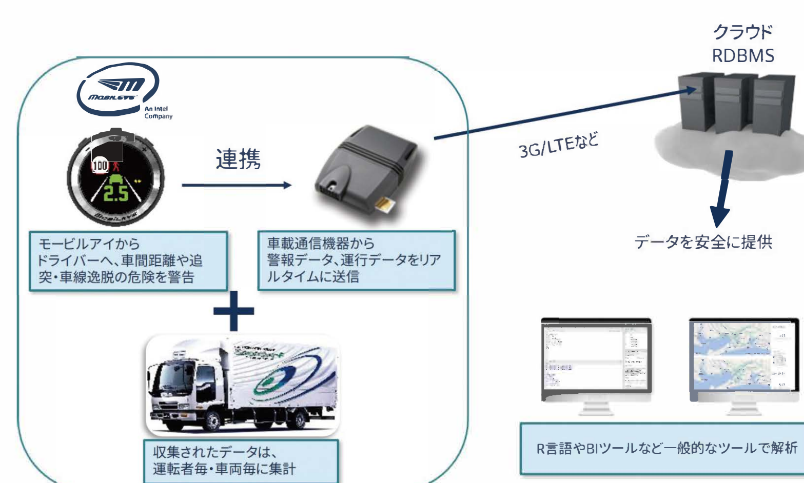
図1: モービルアイ連携による先進PD収集システム

本プロジェクトでは、上記技術シーズを基に、先進PDの分析・可視化が容易に可能なシステムの開発を行うことを目的としています。開発ターゲット1は行政による道路安全管理のためのシステム、開発ターゲット2は事業者による運行安全管理のためのシステムです。そして、先進PD収集からデータ分析を通じて交通安全管理コンサルティングまでを好循環させるデータ地産地消エコシステム構築を目指した実証実験を行います。